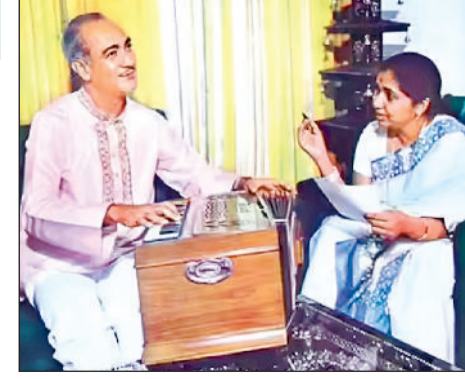
1952 में आसमान से कैरियर किया शुरू साल 1926 में लाहौर में जन्मे ओपी नेयर ने 1952 में 'आसमान' फिल्म से अपना कैरियर शुरू किया, लेकिन उन्हें असली पहचान गुरु दत्त की फिल्मों से मिली। रिद्धम किंग और 'ताल का बादशाह' कहे जाने वाले नेयर ने 'आर पार', 'मिस्टर एंड मिसेज 55', 'सीआई डी' और 'तुम सा नहीं देखा' जैसी फिल्मों के लिए काम किया और उनके काम ने उन्हें हर तरह जगमगा दिया। जितनी उनके प्रोफेशनल लाइफ की चर्चा होती थी, उतनी ही पर्सनल लाइफ की भी। आशा भोंसले के साथ उनके रिश्ते ने उनकी जिंदगी को झकझोरकर रख दिया। उसके बाद न तो वो अपने परिवार के रहे और न ही आशा भोंसले के हो पाए। आशा भोंसले को सुपरहिट बनाने का श्रेय अगर किसी को दिया जा सकता है तो वो थे ओपी नेयर। उन्होंने आशा की आवाज और रेंज का फायदा उठाते हुए उन्हें मैक दिलवाए। उन्हीं की वजह से आशा भोंसले को उनकी पहचान मिली जो आज भी हर किसी के दिल में बनी हुई है।