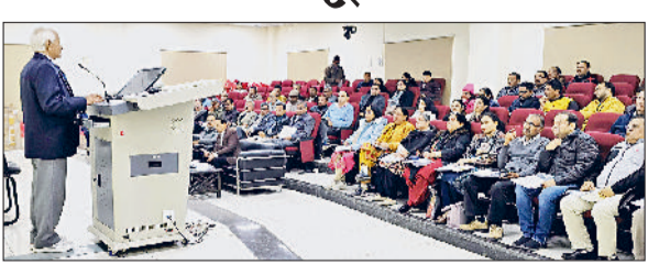
सिरसा। कार्यशाला को संबोधित करते वक्ता।