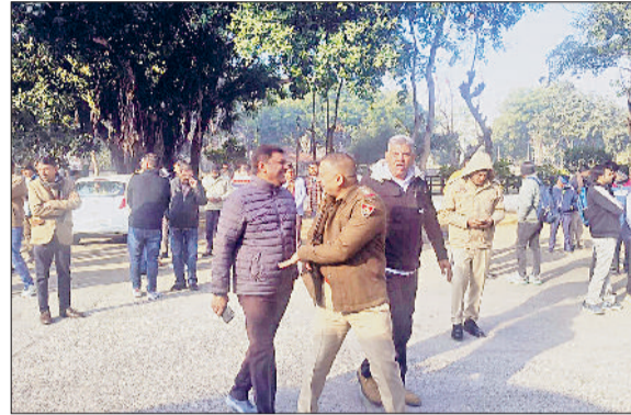
फतेहाबाद। बम की धमकी के बाद बाहर निकले कर्मचारी।

आम लोगों की एंट्री पर लगाई रोक बता दें कि फतेहाबाद के उपायुक्त डॉ. विवेक भारती इन दिनों ट्रेनिंग पर गए हुए हैं। उनकी अनुपस्थिति में एडीसी अनुराग दालिया कार्यवाहक डीसी का कार्य देख रहे हैं। बताया जाता है कि शुक्रवार सुबह 7:55 बजे फतेहाबाद के डीसी की मेल पर लघु सचिवालय को बम से उड़ाने का मेल आया। उस समय लघु सचिवालय में कर्मचारियों की हजिरी कम थी। सचिवालय को बम से उड़ाने की धमकी की जानकारी मिलते ही कर्मचारियों में