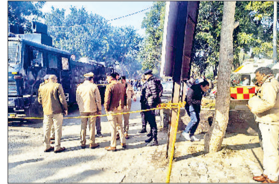
फतेहाबाद। लघु सचिवालय में तैनात पुलिस बल।

बम से उड़ाने की धमकी मिल चुकी है। 21 मई 2025 को भी इसी प्रकार फतेहाबाद की डीसी की मेल आईडी पर लघु सचिवालय को बम से उड़ाने की धमकी मिली थी।