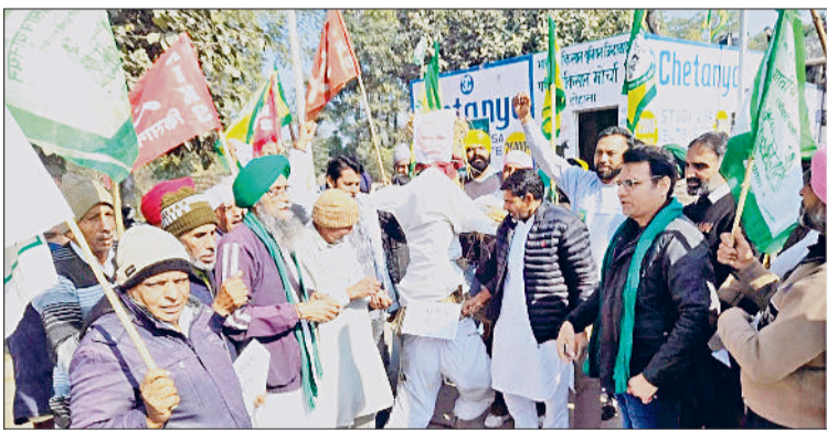
टोहाना