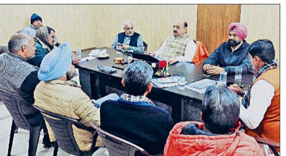
फतेहाबाद। बैठक में तैयारियों को लेकर चर्चा करते बीजेपी पदाधिकारी।