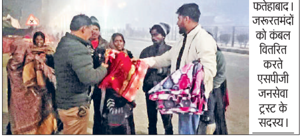
फतेहाबाद। जरूरतमंदों को कंबल वितरित करते एसपीजी जनसेवा ट्रस्ट के सदस्य।