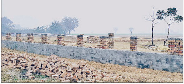
भूना। टोहाना रोड पर अवैध कॉलोनी में बनाई गई मिट्टी की सड़क व पार्क आदि।