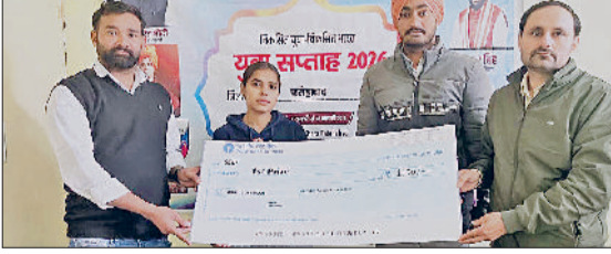
फतेहाबाद। निबंध प्रतियोगिता के विजेता विद्यार्थियों को सम्मानित करते हुए अतिथि।