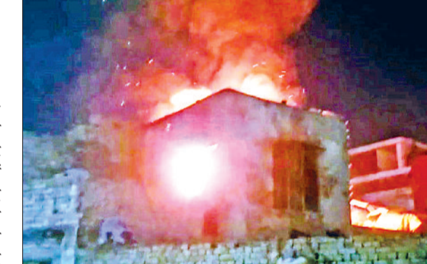
टोहाना। मकान में लगी आग।