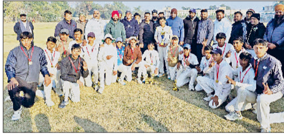
फतेहाबाद। विजेता टीम को पुरस्कृत करते अतिथिगण।