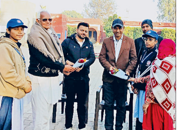
फतेहाबाद। मेहवाला स्थित शहीद नरेंद्र सिंह राजकीय सीनियर सेंकेडरी स्कूल में अतिथियों का स्वागत करते स्कूल स्टाफ व एसएमसी सदस्य।